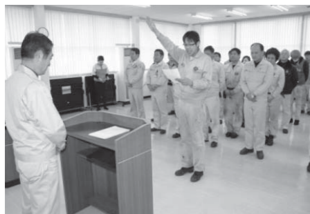
決起集会で一人ひとりが決意表明

前回の禁煙コンテスト(2015年12月～1月)では、福島製鋼(株)が会社を挙げて禁煙活動を展開され、禁煙コンテストに56名の方が参加して頂き、36名の方が、禁煙に成功されました。