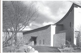
ひの・那須プラトー

〒325-0303 栃木県那須郡那須町 高久乙遅山3375-1066 TEL 0287-78-0470 収容人員 36名