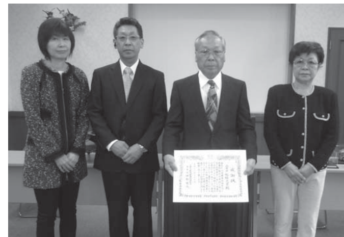
(10月9日 於:山中荘 多目的ルーム)